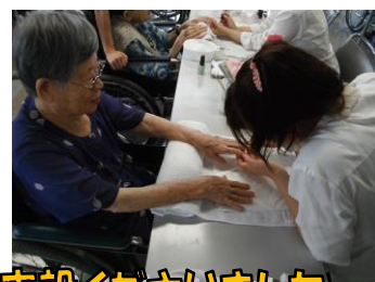
8/2(金)、タラ美容福祉専門学校の学生さんたちがボランティアに来設くださいました。