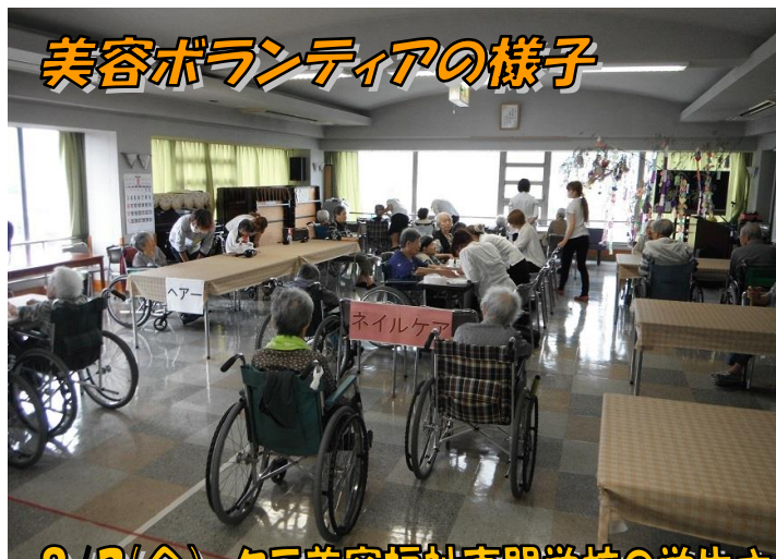
美容ボランティアの様子